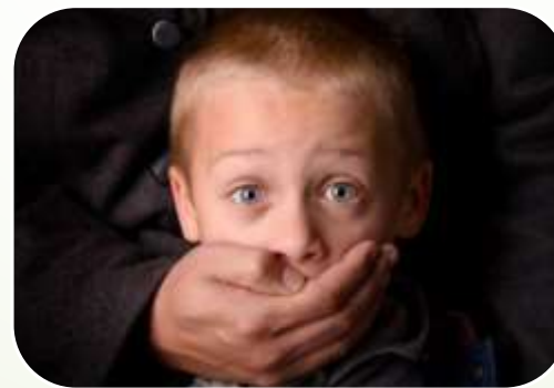
Перевезення шляхом обману чи примусу