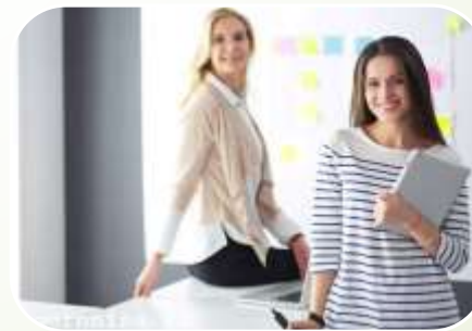
Обмеження кола спілкування