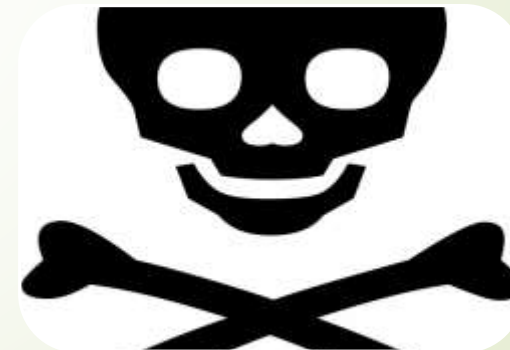
Створення небезпечних для життя ситуацій