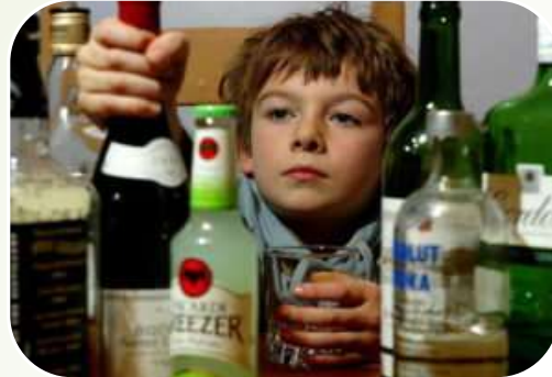
Примус до вживання алкоголю