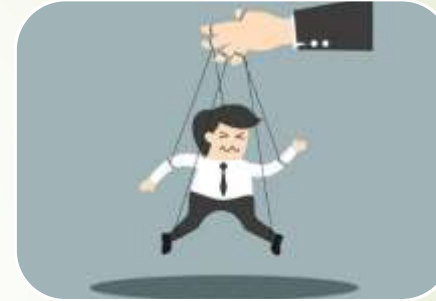
Маніпуляції та шантаж