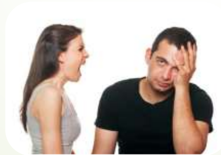
Безпідставні ревності, обвинувачення