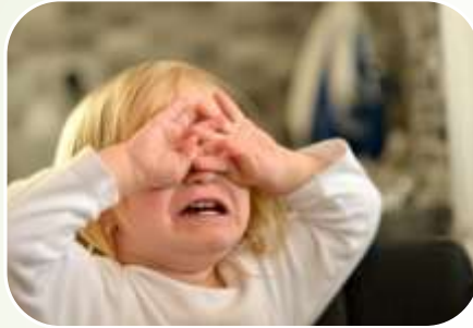
Словесні образи та насмішки