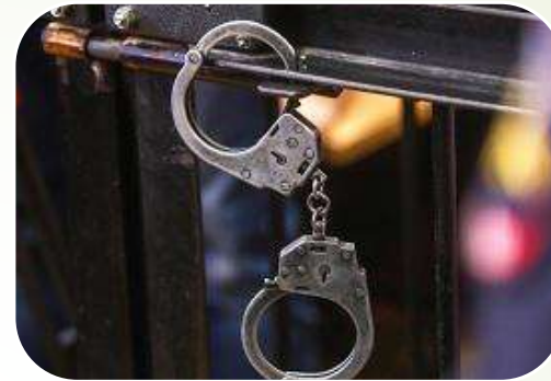
Перешкоджання вільному пересуванню