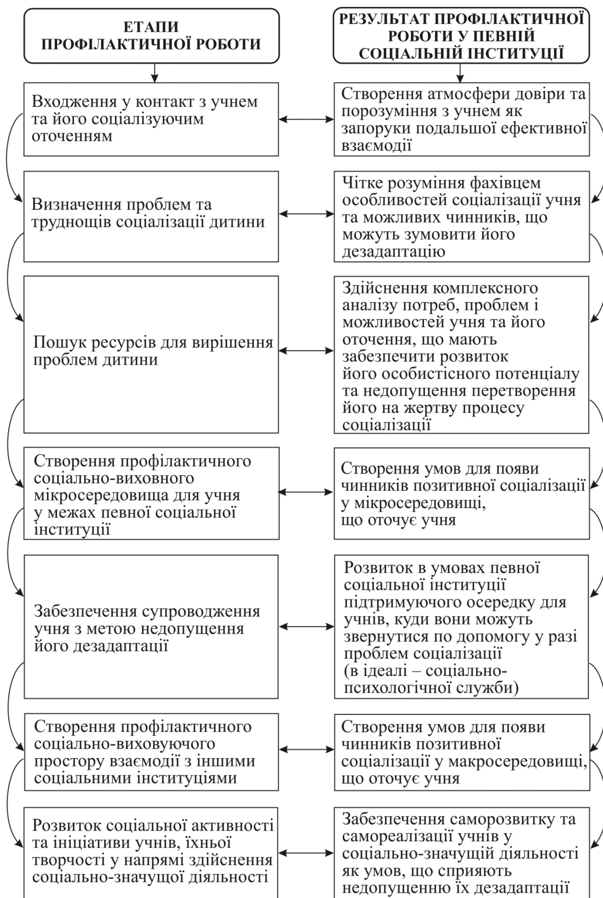
Табл. 1. Алгоритм роботи фахівців соціальної сфери з профілактики девіантної поведінки учнів