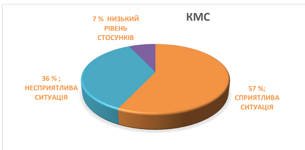
Рис. 2.2. Рівні стосунків у сім'ї.

згубний вплив на особистісний розвиток підлітка. До цієї групи ми віднесли малюнки, де відсутній будь-хто з членів сім'ї, підліток намалював себе сумним, далеко від батьків, наявне занепокоєння, ворожість у ставленні до дорослих через штрихування деталей, відсутність деяких частин тіла. 7% сімей характеризується низьким рівнем батьківських стосунків. На малюнках цієї групи зображено заляканий вираз обличчя дитини, відчувається емоційна напруга через використання у малюнку темних фарб, наявна ворожість до батьків через промальовування таких деталей, як розведені руки, розчепірені пальці і т.д.