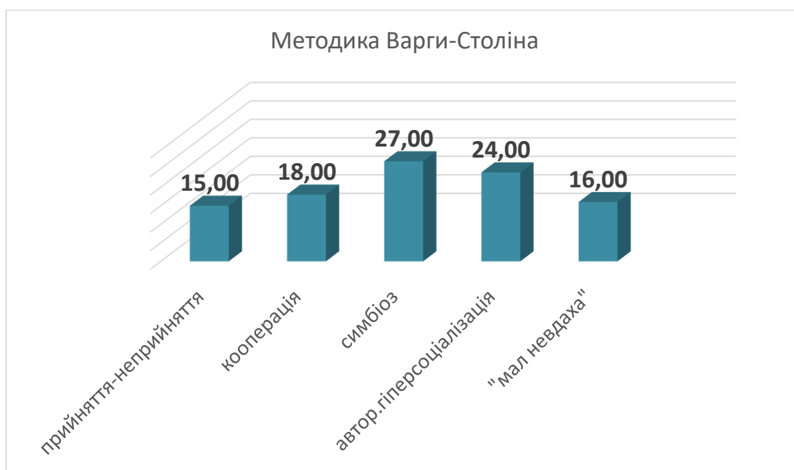
Рис. 2.1. Стилі батьківського ставлення за методикою Варги-Століна.

Для 18 % протестованих притаманне ставлення «кооперація», яке проявляється у зацікавленості батьків планами дитини, намаганні допомогти, високій оцінці інтелектуальних та творчих здібностей дитини (див. рис. 2.1)