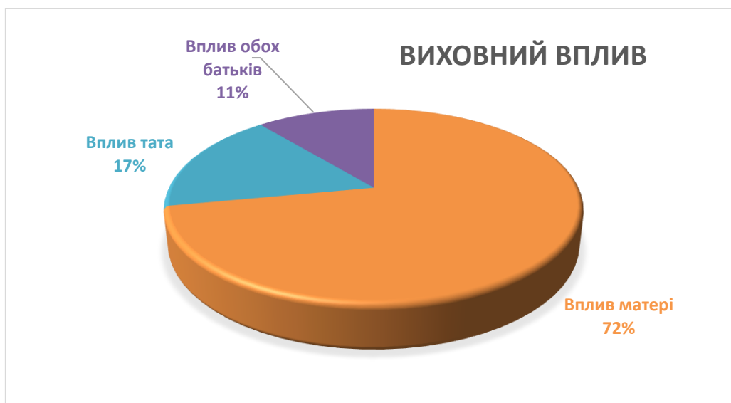
Рис.2.4. Домінування виховного впливу батьків.

Також, опитувальник дозволив визначити одного з батьків, виховний вплив якого є домінуючим. З'ясовано, що в більшості сімей роль вихователя належить матері (72 %), сім'ї, у яких провідна роль у вихованні належить батькові, становлять 17 %, обом батькам – 11 %. Це призводить до дефіциту батьківської опіки та контролю в процесі зростання та становлення дітей. Результати показані на рис.2.4.