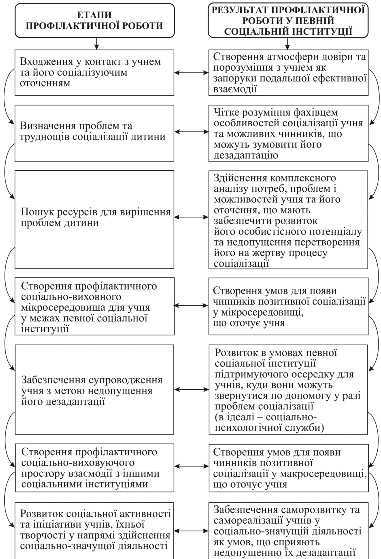
Рис. 1.1. Алгоритм роботи фахівців соціальної сфери з профілактики девіантної поведінки учнів