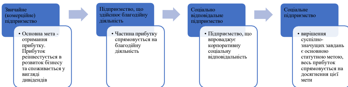
Рис.1.1. Трансформація комерційного підприємства в соціальне

З огляду на те, що соціальне підприємство не визначено як юридичний термін в законодавчому порядку, його трактовка є інколи розмитою та відповідно присутня дискусія щодо того, які підприємства можна вважати соціальними. Аналіз різноманітних джерел [3-22] дозволив нам сформулювати принципові відмінності між комерційним та соціальним підприємствами та вектор трансформації “комерційного” підприємства у “соціальне” (рис.1.1).