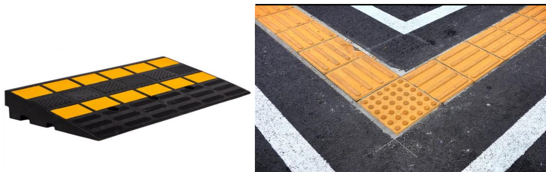
Мал.3.3. Нанесення контрастних покриттів покращення просторової орієнтації для людей з порушеннями зору

Безпека та цілісність структури. У сучасному світі, ДБН В.2.2-15-2006 "Будівельна класифікація України. Класифікація будівель за функціональними ознаками", ДБН В.2.2-16-2005 "Інвалідність", ДБН В.2.2-17-2008 "Доступність для людей з обмеженими фізичними можливостями", ДБН В.2.2-18-2001 "Доступність для людей з обмеженими можливостями зору", ДБН В.2.2-22-2006 "Будівлі та споруди. Доступність інвалідів", ДБН В.2.2-24-2006 "Будівельні конструкції. Основні положення", ДБН В.2.2-25-2006 "Порушення функцій органів опорно-рухового апарату. Засоби пристосування", ДБН В.2.2-26-2013 "Будинки і споруди. Загальні вимоги до безпеки використання" у основних положеннях "Інклюзивність будівель і споруд" є обов'язковими до виконання, особливо у сфері туризму. В них наведені всі необхідні технічні характеристики влаштування елементів безбар'єрності, а також конкретні візуальні приклади, як це потрібно робити. Зокрема, у документах йдеться про облаштування [2]: