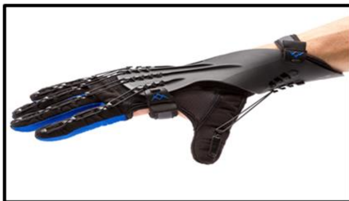
Малюнок 3.5. Пристосування для осіб з порушеннями опорно рухового апарату

- для осіб з порушеннями слуху , найбільш комфортним буде застосування не тільки самого меню з переліком страв, а й роз'яснення, що в них включено, яке включатиме пояснення мовою жестів.