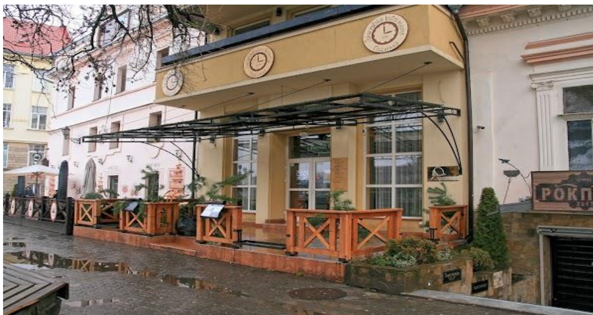
Мал.3.2. Зовнішній вигляд об'єкту

Сама локація має достатній доступ для людей, які пересуваються на колісних кріслах і осіб з порушеннями зору, завдяки великим просторам мосту та площі, але вже сам об'єкт має деякі складнощі у доступі (Мал. 3.2).