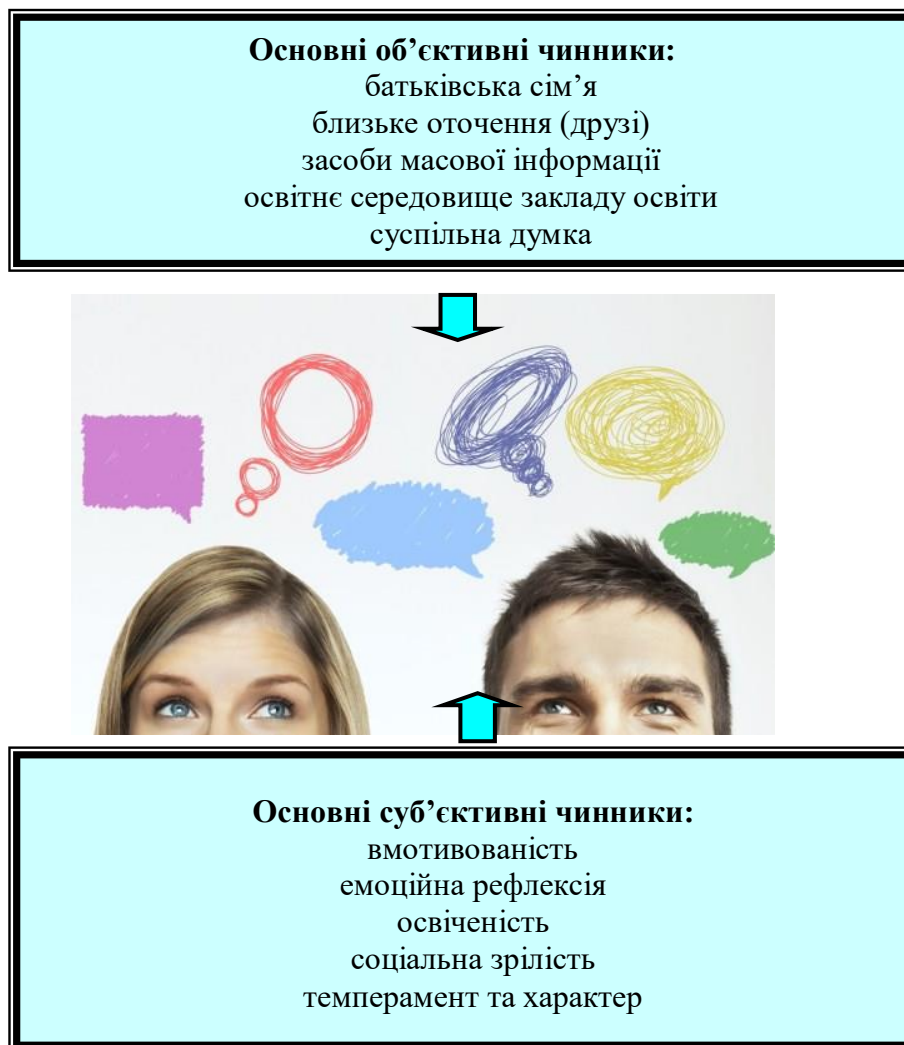
Рис. 2.1 – Основні суб'єктивні та об'єктивні чинники, що впливають на усвідомлення студентською молоддю сімейних ролей

При цьому варто зазначити, що суб'єктивні чинники базуються на певних індивідуально-психологічних характеристиках особистості, а саме: