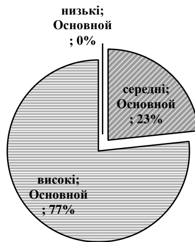
Рис. 2.2.3. Співвідношення показників афективної агресивності

піддослідних (77 %), середні – для 14 чоловік (20 %), низькі – не спостерігалися (рис. 2.2.3).