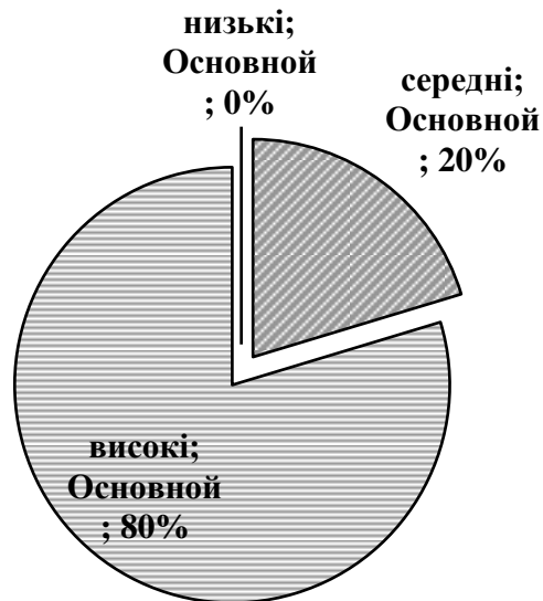
Рис. 2.2.2. Співвідношення показників поведінкової агресивності

Таким чином, часті прояви агресивності в поведінці є характерними для більшості піддослідних.