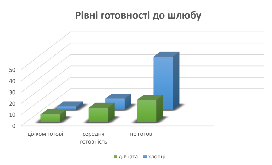
Рис. 2.2. Діагностика рівнів готовності до шлюбу за методикою Юнда.

психологічно цілком готовими до сімейного життя, розподілені на 3% хлопців та 7% дівчат. 23% виявили середню готовність до укладання сімейного союзу, уточнено, що 10% цього показника належать хлопцям та 13% – дівчатам. 67% опитуваних визнали свою неготовність до створення сім'ї, в поділі на 20% дівчат та 47% хлопців.