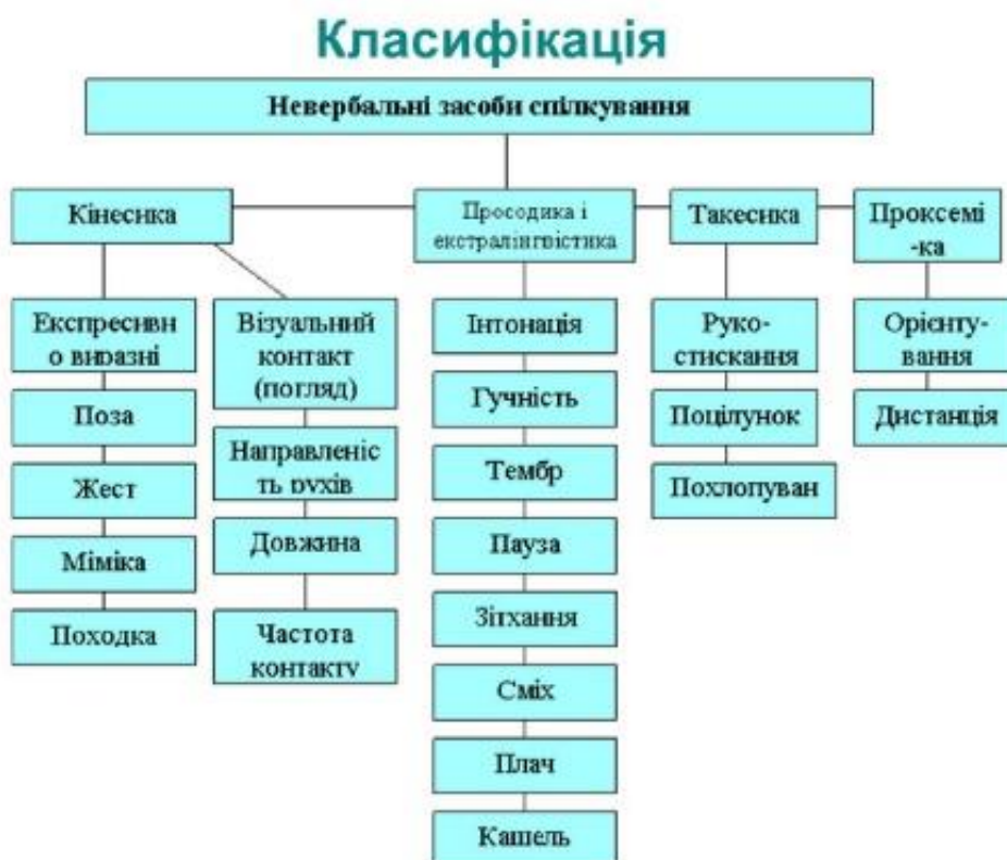
Рис. 1.1. Структурна схема невербальної поведінки людини

Усі види невербальних повідомлень не ізольовані, а знаходяться у взаємодії, іноді доповнюючи один одного, іноді суперечивши один одному [13].